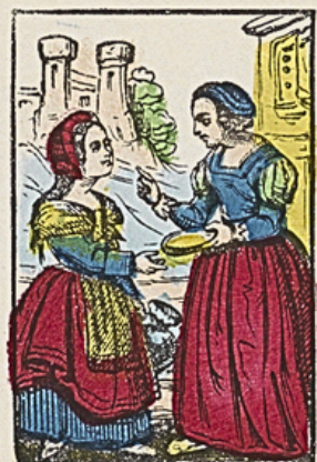
Roodkapje krijgt het broodje en de pot boter van hare moeder, om bij hare grootmoeder te brengen.