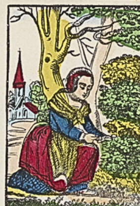
Zij plukt hazelnoten terwijl hare grootmoeder haar met ongeduld wacht.