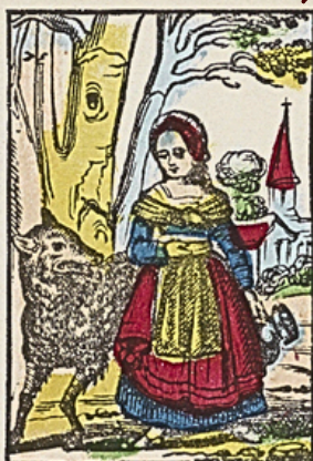
Zij vraagt den weg aan een wolf die haar zegt: links af.