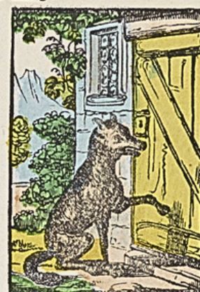
De wolf komt vóór haar aan, klopt aan de deur en bootst hare stem na.