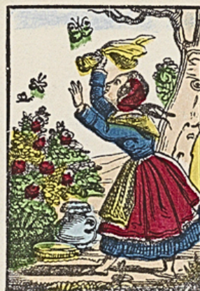
Zij vangt liever kapellen dan hare moeder gehoorzaam te zijn.